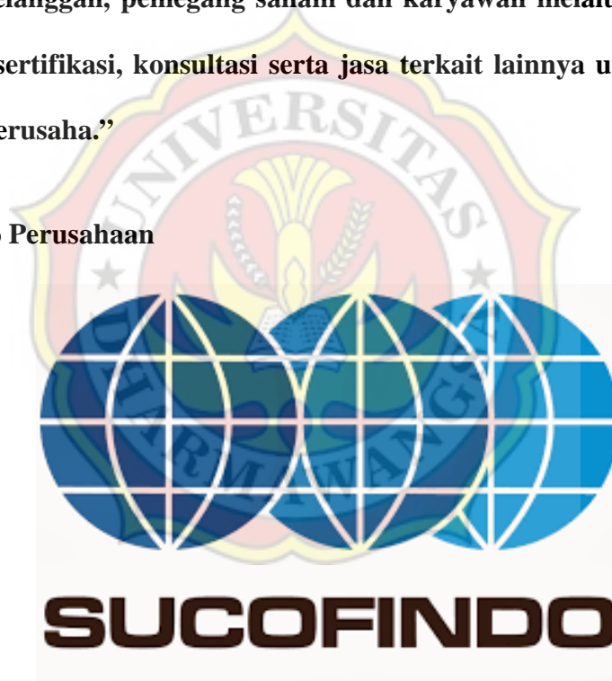
Gambar 1.2 Logo Perusahaan

Identitas perusahaan berupa logo TIGA BOLA DUNIA melambangkan kegiatan usaha Perseroan yang memiliki ruang lingkup Internasional dan mempersatukan tiga kawasan yaitu di darat, laut dan udara.