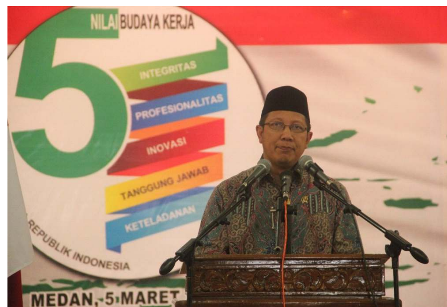
Menteri Agama RI, Lukman Hakim Saifuddin, ketika memberikan arahan dan bimbingan pada kegiatan Pencanangan 5 (lima) Nilai Budaya Kerja Kementerian Agama Republik Indonesia di Asrama Haji Medan, tanggal 5 Maret 2015.