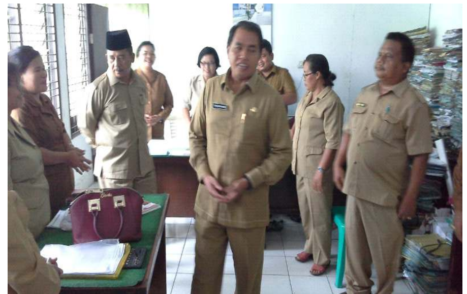
Kepala Kantor Wilayah Kementerian Agama Provinsi Sumatera Utara ketika melakukan Inspeksi di Kantor Kementerian Agama Kabupaten Deli Serdang pada hari pertama bekerja setelah libur dan cuti bersama Idul Fitri tanggal 3 Juli 2017.